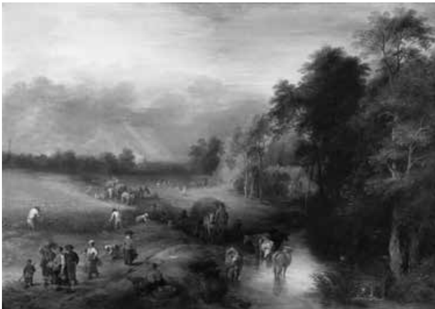
THEOBALD MICHAU Sotheby's Londres 43,5 cm x 62,5 cm.

NOTE: This work is a beautiful Flemish landscape very typical within Michau’s style and repertoire. This work was part of the renown Baron Evence Coppée III collection; this collection was established in 1920 and exclusively included Flemish XVI and XVII century works. This landscape was exhibited at the Toby Museum of Art in Tokyo in “ The world of Brueghel the Coppée Collection, and Eleven Internationals Museums ” exhibition.