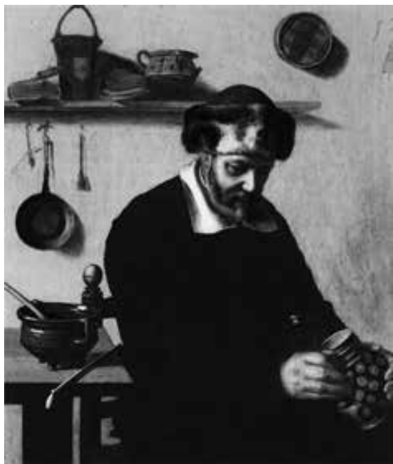
CONSTANTYN VERHOUT Milwaukee, Colección Privada.

NOTE: This work shows an elderly man resting in a room while enjoying some pieces of cheese, a drink, and smoking his pipe. On the floor inside the box where he rests his foot there are embers to warm up the room. The incoming light divides the room diagonally and the viewer can see the elderly man looking at the smoke coming from his pipe. A small dog is cuddled underneath the feet of his owner. The scene captures the daily life in the Netherlands and emphasizes with strength the unique lyricism. It is very common for Dutch artists to include dogs in their genre compositions but in this case the dog has a very human-looking and sweet face. The billows of smoke in the sky and the light that comes into the middle of the work follow a caravaggist style. The scene characterizes the genre scene of the time, in which in the house was where people would go to escape the hectic street life. It was in the house where people were able to purify themselves after the hardships of the day. The household was also a place that was purified from the material world; it allowed each individual to reflect upon the time of silence and rebuild his or her strength to rejuvenate their spirit.