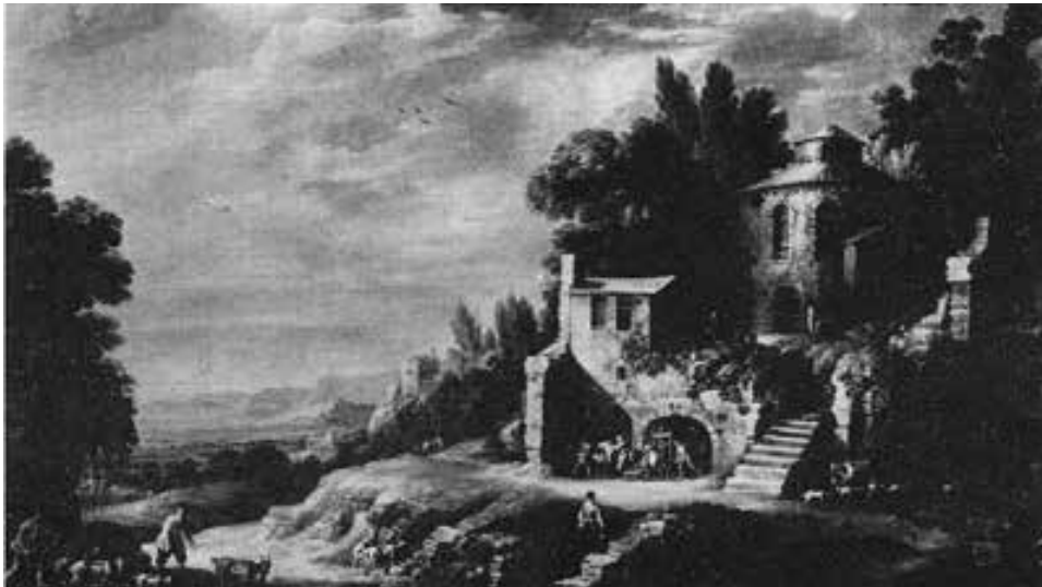
GILLIS PEETERS Paisaje italiano con pastores y rebaños

NOTE: This landscape has a beautiful composition that includes a dovecote along with numerous pedestrians doing their daily errands. The sky takes up a great portion of the canvas and gives great depth and light to the work.