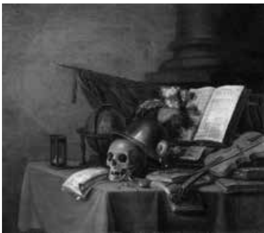
ADRIAEN VERDOEL Remiremont, Musée Charles de Bruyères

NOTE: This wonderful vanitas is very characteristic of the Dutch Golden Age. This piece invokes “the transitional nature of the human life” symbolized by using the candle, the sand watch, and the skull. Frivolity is shown through the deck of cards. The military helmet is adorned with a flashy red, white, and black feather that rests against a sword. The viewer can see the sword's handle, which is a main element within the picture. The sword symbolizes power, success, and conquest, which again refer to power being earthly and conquest being momentary. On the other hand, the spiritual is exemplified with the books and musical instruments, which are seen as eternal. The bright reds stand out against the earth colors within the composition.