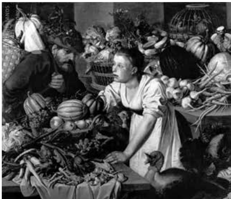
PIETER CORNELIS VAN RIJCK North Carolina Museum of art.

NOTE: This magnificent painting combines the harmony of a still life that includes fruits, vegetables, and even fish with a daily life scene. The daily life scene in this work is probably the relationship of father and daughter in a kitchen environment. Kitchen interiors show in a rudimentary way the typical aspects of still lives. This work shows the typical items found in kitchens such as varied fruits, copper pots, pitchers, pewter plates, clay platters with eggs and bread, etc. The works that show interiors also unveil the homes socioeconomic condition; the viewer is able to know if the house shown belongs to a bourgeois family or a feudal family pretending to live an elevated lifestyle. This theme was one of the most common representations in the Dutch Golden Age as food and its production and procurement was a common struggle.