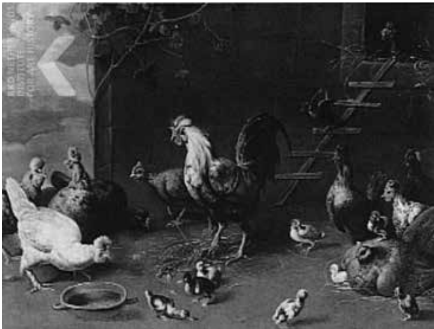
ADRIAEN VAN UTRECHT Paris, Francia.

NOTE: In this work, the artist is able to show the viewer a very balanced interior scene with a chicken coop. In this coop, one can find almost every single bird that one would commonly seen on a farm. In the picture each bird is shown with incredible realism.