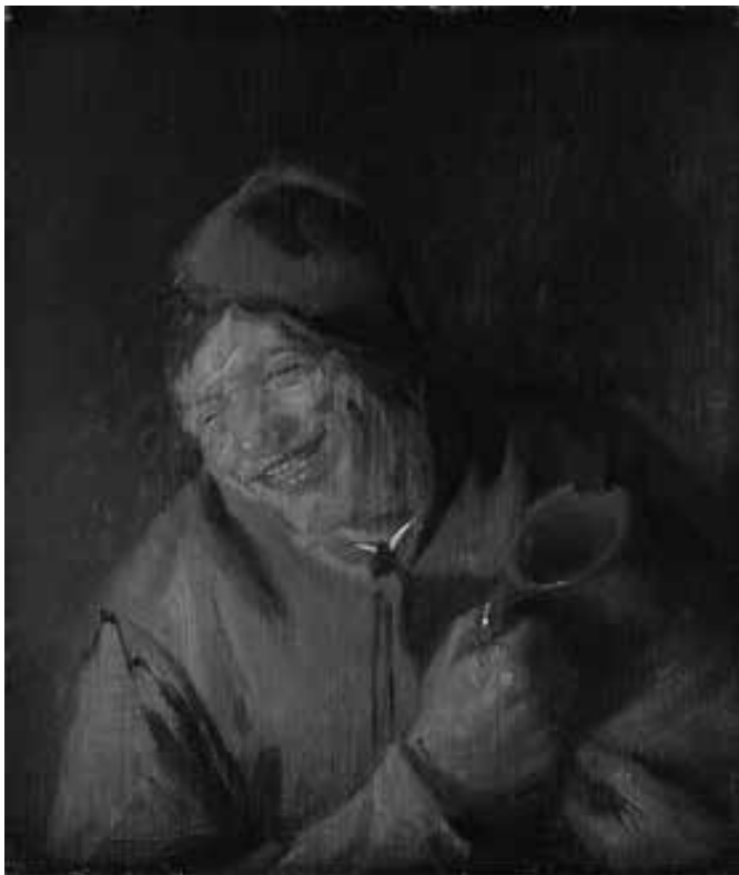
ADRIAEN VAN OSTADE “El campesino alegre”

NOTE: This small work is an exquisite painting that strongly represents a singer. Only a painter such as Adriaen van Ostade would be able to give so much soul and personality to this character while creating with his technique such an emblematic and perfect work.