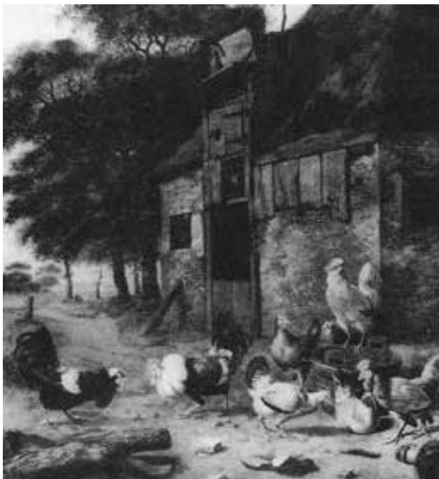
DIRCK WYNTRACKT Munich, art trade.

NOTE: This work showcases a barn in the background, which was very common in the works by Wyntrack. In the foreground the main focus are the hens that look like they are about to step out of the fram. The hens' highlights are the white and yellowish colors against the ocher and brown that fill the rest of the composition. In this century, the secularization of art allowed artists to paint any aspect of daily life. This tendency includes animals because they were part of everyday life and were painted as frequently as humans. On the other hand, the hens symbolize fertility, maternity, and protection.