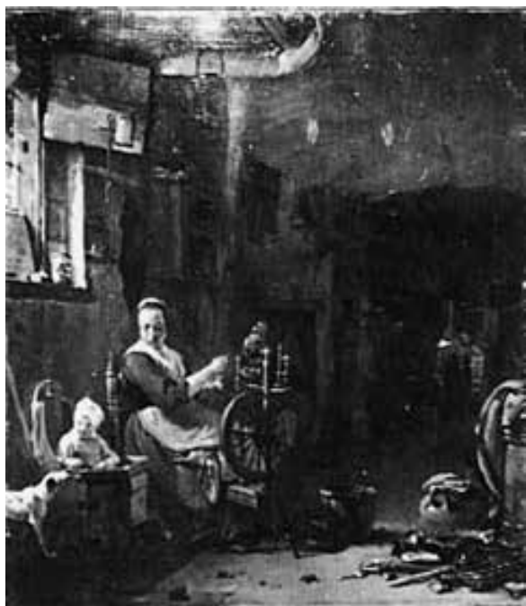
THOMAS WYCK Rijksmuseum, Amsterdam.

NOTE: Scene with Washerwoman is a very characteristic work within Wyck's artistic repertoire under the influence of the Italianizing style. The work shows a Roman patio that serves as a representation of daily life. The piece features a woman washing copper pots while being observed by her dog and surrounded by kitchen utensils and vegetables. The viewer is also able see other villagers that are eating or running their errands. At the London Witt Library there is a photograph of this painting because it was sold in Helbing Munich in 1903. In the library documents, this work appears signed and dated 1663 but currently there is no signature or date.