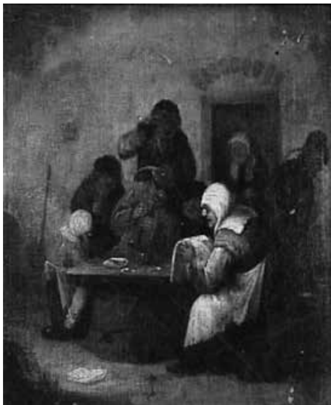
B.MOLENAER Galería Koller, Zurich

NOTE: The most appealing aspect of this work is how carefully the contrast of lights and shadows is created. All characters show the majestic use of the brown tonalities, and the composition is very similar to those demonstrated in works by Adriaen van Ostade. It is also interesting to note how the blue on one of the villagers contrasts with the otherwise monochromatic composition.