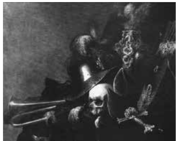
ADRIAEN VERDOEL Ehemals Londres, Kunsthandlung Speelman.