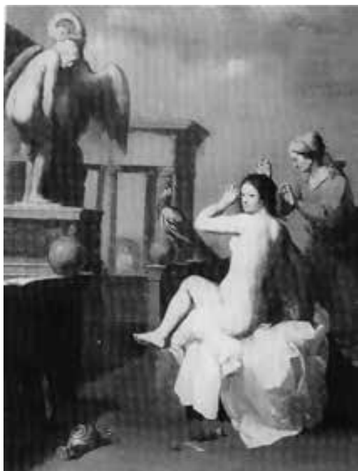
CORNELIS POELENBURGH Óleo sobre tabla 39 cm. x 31 cm. Colección privada, Escocia.

Bathsheba’s child by David was struck with a severe illness and died a few days after birth, which the king accepted as his punishment. Nathan also noted that David’s house would be cursed with turmoil because of this murder. This came to pass years later when one of David’s much-loved sons, Absalom, led an insurrection that plunged the kingdom into civil war.